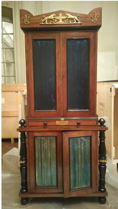
Un des deux corps de bibliothèque prêtés par le Napoleonmuseum d'Arenenberg en Thurgovie

milieu et était (deux mots indéchiffrables) dans Je reste. Ces corps qui étaient couronnés d'une petite corniche avaient pour ornement des baguettes de bois noir.